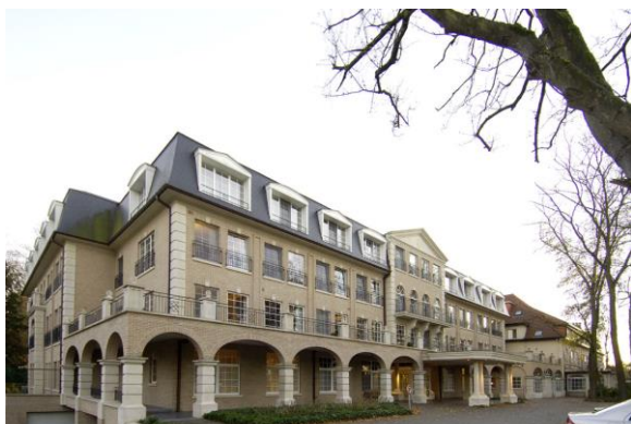
Zonneweelde – Rijmenam (BE) - situation actuelle

Cofinimmo accompagne son opérateur-locataire Senior Living Group (Groupe Korian) dans la réorganisation de la maison de repos et de soins Zonneweelde à Rijmenam. Elle a obtenu les permis nécessaires et débutera les travaux dans le courant du troisième trimestre de 2017.