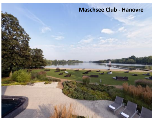
Maschsee Club - Hanovre