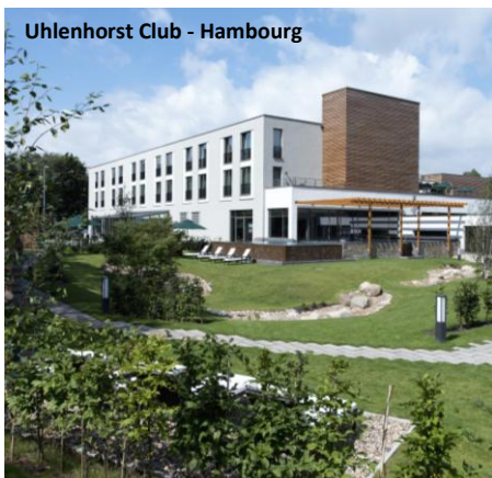
Uhlenhorst Club - Hambourg

Bruxelles, embargo jusqu'au 05.06.2015, 17:40 CET