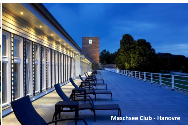
Maschsee Club - Hanovre