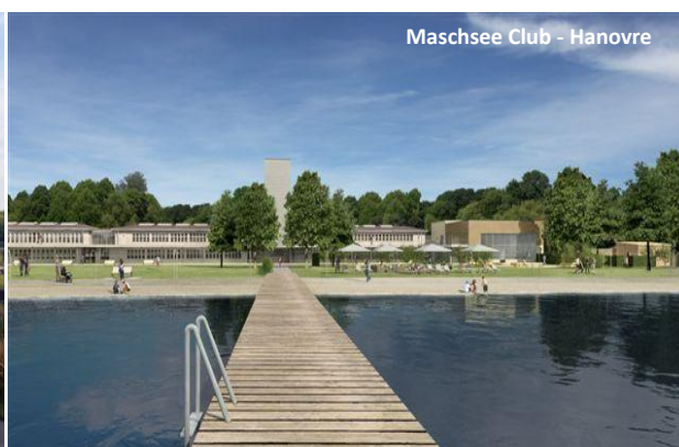
Maschsee Club - Hanovre