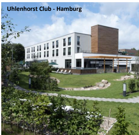
Uhlenhorst Club - Hamburg

Brussel, embargo tot 05.06.2015, 17u40 CET