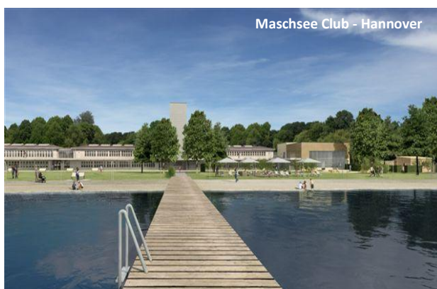
Maschsee Club - Hannover