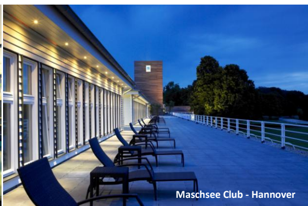
Maschsee Club - Hannover