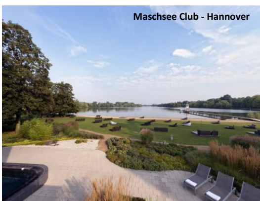
Maschsee Club - Hannover