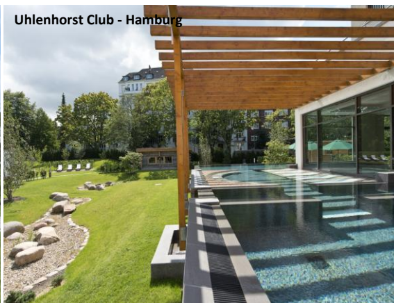
Uhlenhorst Club - Hamburg