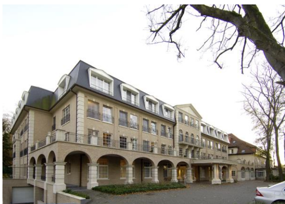
Zonneweelde – Rijmenam (BE) – huidige situatie

Cofinimmo begeleidt haar huurder, uitbater Senior Living Group (Korian Groep), bij de reorganisatie van het woonzorgcentrum Zonneweelde te Rijmenam. Zij ontving daarvoor de nodige vergunningen. De werken starten in de loop van het derde kwartaal van 2017.