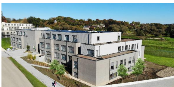
Maison de repos et de soins – Résidence de Wégimont – Soumagne