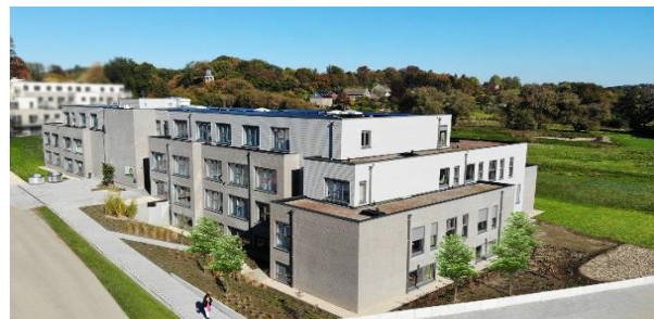
Woonzorgcentrum – Résidence de Wégimont – Soumagne